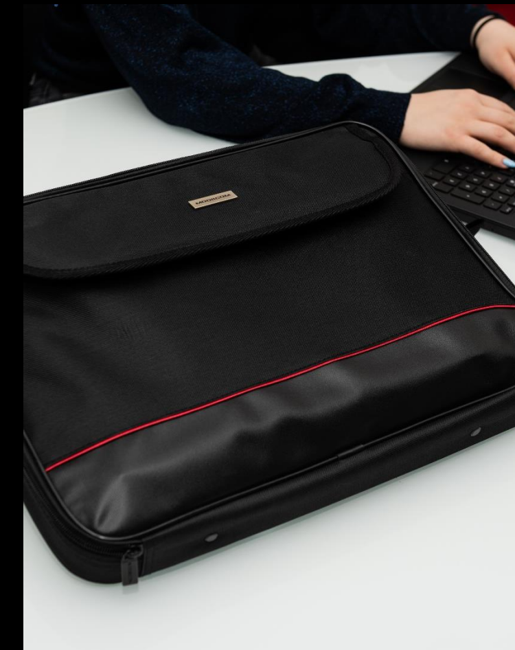
Miejsce na laptop 17"