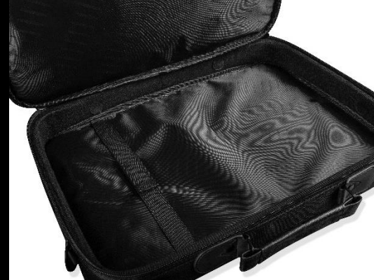
Bezpieczny transport laptopa