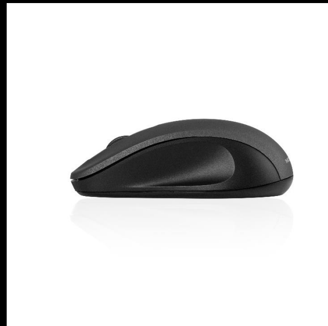
Do domu i biura